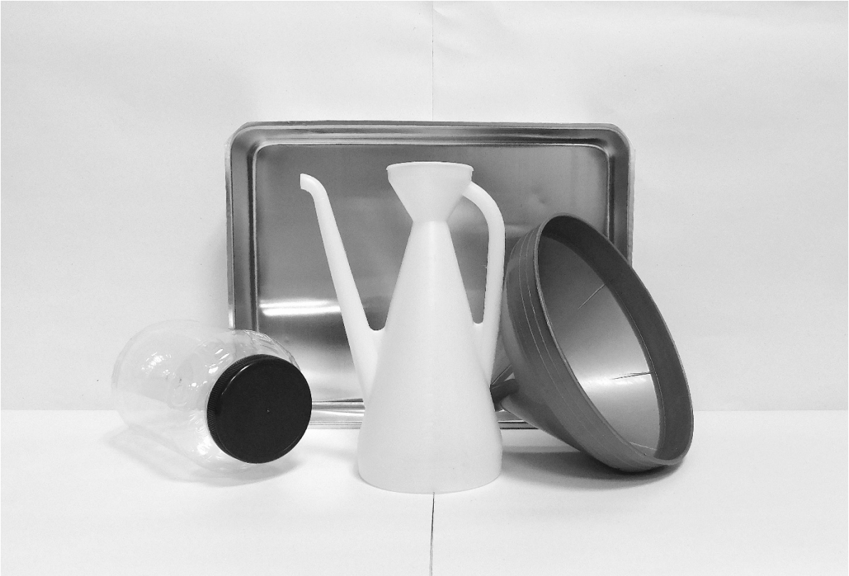
πρώτη φωτογραφία: μπροστινή όψη