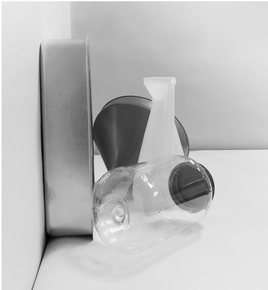
τέταρτη φωτογραφία: πλάγια όψη 2