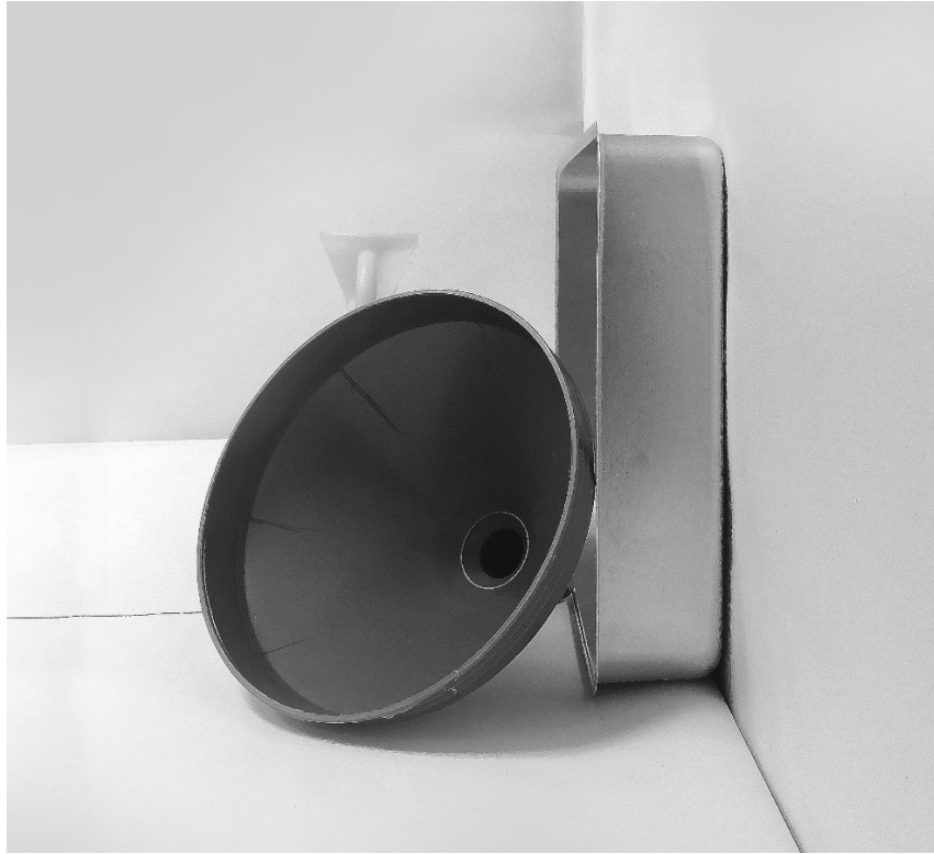
τρίτη φωτογραφία: πλάγια όψη 1