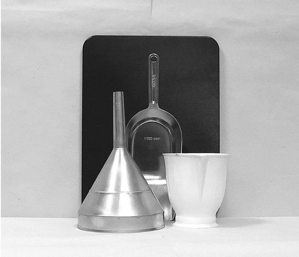
πρώτη φωτογραφία: μπροστινή όψη