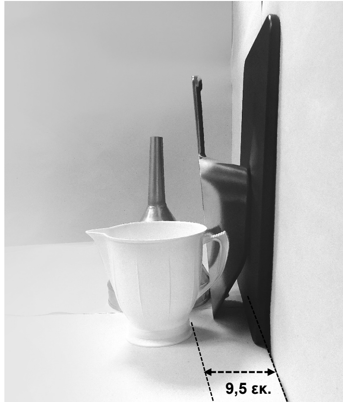
τρίτη φωτογραφία: πλάγια όψη 1