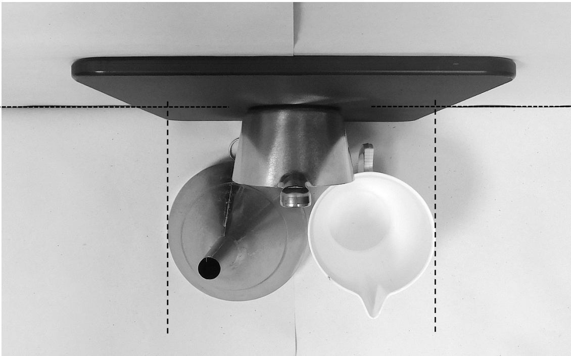
δεύτερη φωτογραφία: κάτοψη